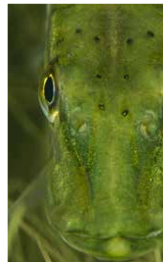
Gros plan sur un brochet