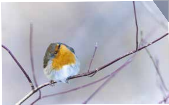
Rouge-gorge – Erithacus rubecula