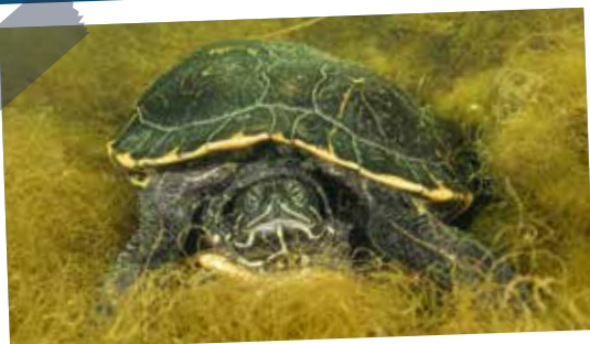
Une tortue de Floride qui depuis dix ans s'est adaptée à son environnement – Trachemys scripta