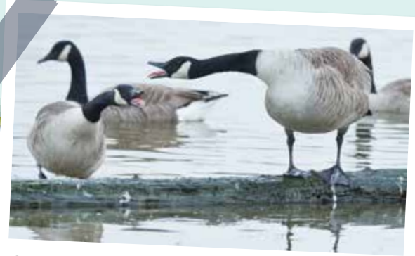
Bernache du Canada – Branta Canadensis