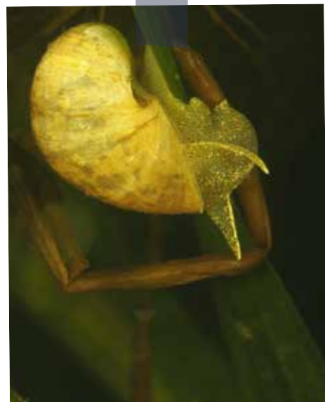
Limnée, un genre de mollusque – Radix auricularia