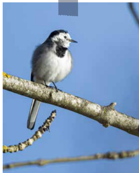
Bergeronnette grise – Motacilla alba

Pour rappel, quelques règles d'usage sont à respecter. Si vous pouvez vous balader à pied ou à vélo, pique-niquer, pêcher en respectant la réglementation en vigueur ou promener votre chien tenu en laisse ; vous ne pouvez pas en revanche vous promener à bord d'engins motorisés, jeter ou déposer de la nourriture pour les animaux ou vous baigner dans les lacs.