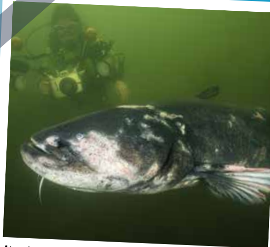
Un silure glane, géant de deux mètres croisé durant l'été 2020