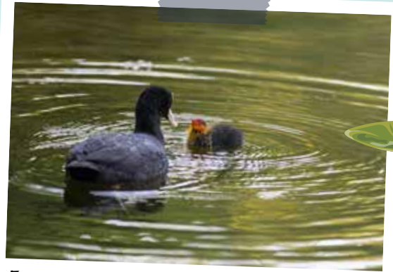
Foulque macroule – Fulica atra